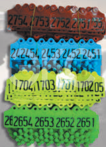
R001 Бирка ушная 44x46 мм, нумерация от 1 до 9999 (5 цветов) (Германия) PrimaFlex

Имеются бирки жёлтого, красного, синего, зелёного и белого цветов. Пронумерованы с двух сторон. Выполняется особое тиснение по заказу. В упаковке по 50 штук (1-50, 51-100, 101-150...). По желанию Заказчика поставляется и большая нумерация.