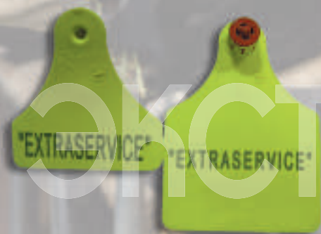
R003 Бирка ушная чистая Flexoplus 20506/161

Использование полиуретана в качестве сырья делает ушную бирку долговечной и эффективной. Используемый твёрдый кольцеобразный наконечник особенно отличает эту бирку от других моделей. Этот наконечник в форме шипа обеспечивает лёгкое прокалывание и одновременно натяжение и фиксацию кожи уха. Благодаря этому происходит бережное прокалывание ушей. Проделанные на стержне шипа отверстия для прохода воздуха обеспечивают вентиляцию ран, а значит, быстрое их заживление. Отделить такую ушную бирку больше не представляется возможным, что гарантирует большую степень безопасности при использовании.