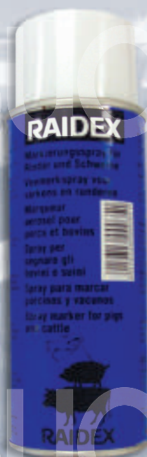
R017 Аэрозоль для маркировки скота RAIDEX (зелёный, жёлтый, красный, синий) (Германия), в балончиках по 400 грамм