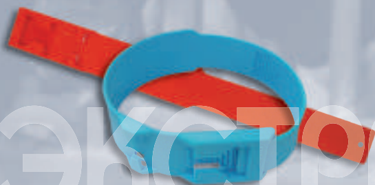
R018 Ленты ножные (красные / синие) (Германия) 20111 / 20112/65