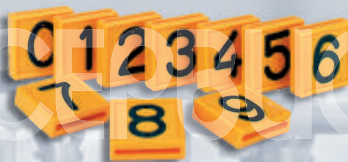
R007 Номера для ошейника от "0" до "9" (Германия) 20885/66