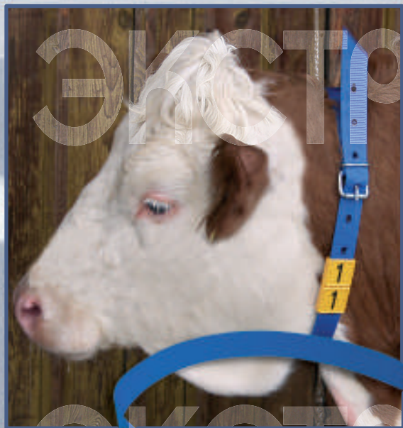
R006 Ошейник для идентификационных номеров, 120 см (Германия) 20868/66