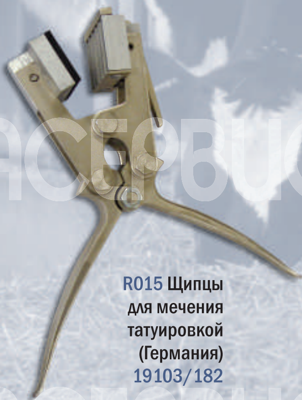
R015 Щипцы для мечения татуировкой (Германия) 19103/182