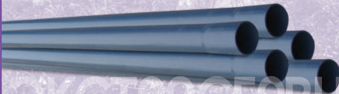
0009 Труба ПВХ д.50 (м/п) 309050