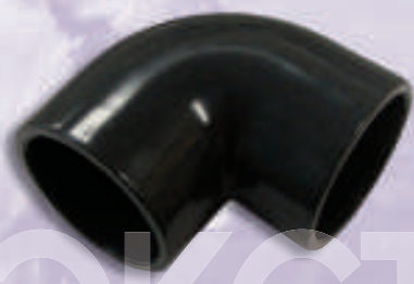
0010 Уголок ПВХ д.50