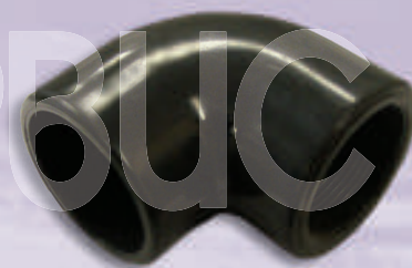
0011 Уголок ПВХ д.50x1 1/2 с резьбой