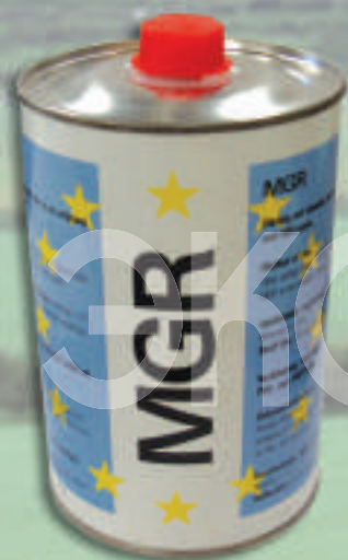
0001 Жидкость для обезжиривания поверхности, 1 литр