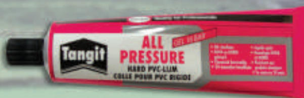
0002 Клей для труб в тубике, 125 грамм