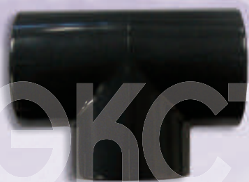
0007 Тройник ПВХ д.50x1 1/2 с резьбой