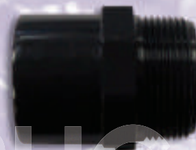
0024 Штуцер ПВХ под вакуумметр д.90x1/2"